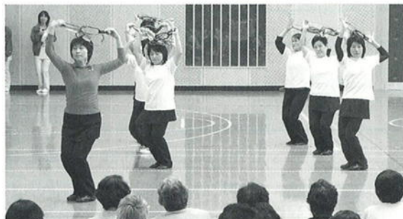
ベルターを使った演技

◆ 問い合わせ先 大山町教育委員会 スポーツ推進室 ☎ 0859-54-5212 FAX 0859-54-5217