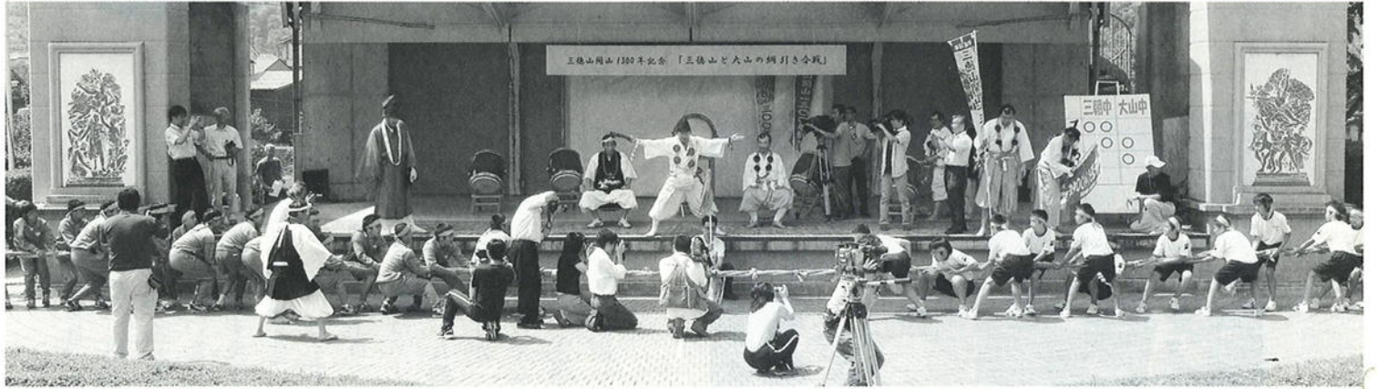
三朝町キュリー広場での綱引き合戦（左が大山中、右が三朝中）

8月4日（金）三朝町のキュリー広場で三朝中と大山中の生徒それぞれ100人が、綱引き合戦をしました。