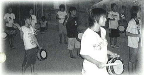
エイサー（沖縄の盆踊り）に参加

私は8月1日から4日にかけて、沖縄県嘉手納町との人材育成交流事業に参加しました。7月から事前学習会があり、係の役割分担や平和学習、また沖縄県や嘉手