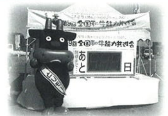
大会マスコット“とりもー”

全国の優秀な和牛が5年に1度、一堂に会してその優劣を競う大会が、10月11日から14日の間、鳥取県で開催されます。