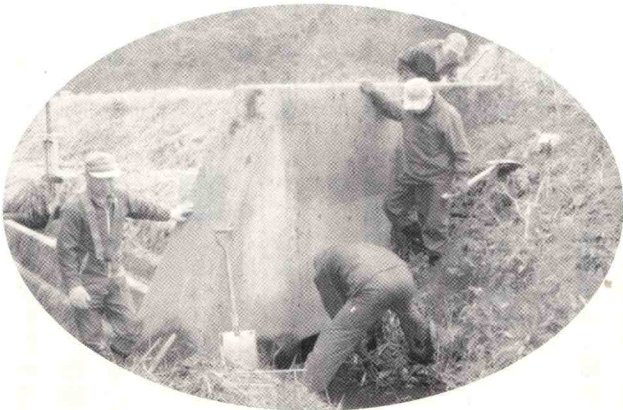
「地域のみんで取り組もう！」農地・水・環境保全向上支援事業