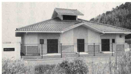
最後に完成した光徳下水処理場

会計・公共下水道事業特別会計は、使用料収入では、維持管理費しか賄えず、元利償還金は、一般会計から合わせて7億4500万円ほど繰り入れている。