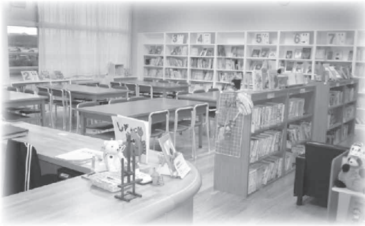
使いやすくなった学校図書館