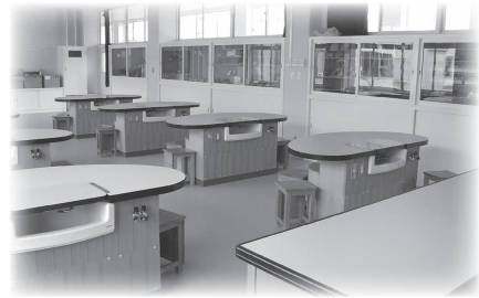
床も貼りがえられ明るい理科室に

屋上防水工事を含め外壁塗装、校舎内もさまざまな改修によって、学習環境も改善されました。