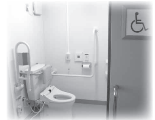
1階廊下の障害者用トイレ