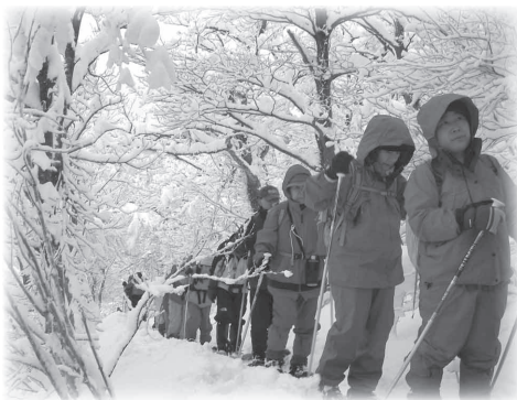
昨年1月のホワイトウォークの様子

■お詫びと訂正 12月号、3ページの新投票区（案）の表中、名和第3投票区（保健福祉センターなわ）に「御来屋港区」とあるのは「御来屋南区」の誤りでした。