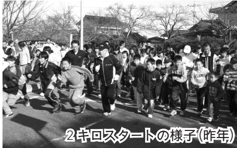
2キロスタートの様子(昨年)