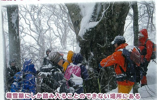
積雪期にしか踏み入ることのできない場所にある ブナの巨木