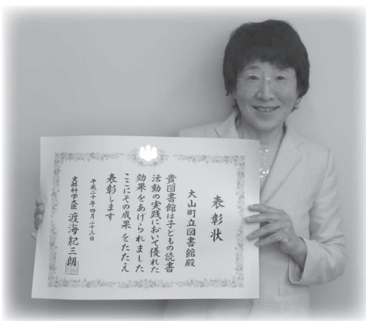
表彰状を手にする船原館長