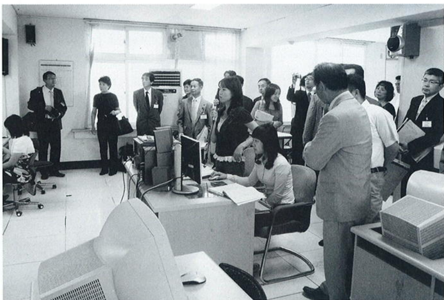
ヤンヤン女子中学校のコンピュータ授業

特産品の物流交流はもちろん、襄陽郡の観光PR、人を呼び込む施設等では参考にしたいところである。また、様々な面でお互いの良質な部分を共有することも必要となる。継続的な交流、積極的な情報交換により関係を一層密にしていけることが、今後の両町郡の更なる発展につながると思った。