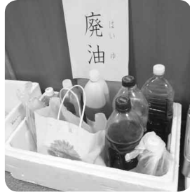
▲中山公民館・各福祉センターの場合