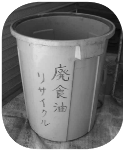
▲名和公民館・大山公民館・こうれいコミュニティセンター・大山農村環境改善センター・ふれあい会館の場合

回収場所まで距離があり、車などでの移動となった場合、どの程度持ち込みにご協力していただけますか？ (回収を希望する人のみ回答)