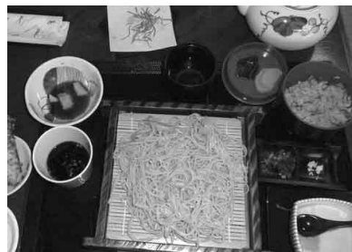
▲150年前の民家を再利用した谷田貝亭で昼食。地元産にこだわったそばをいただきました。