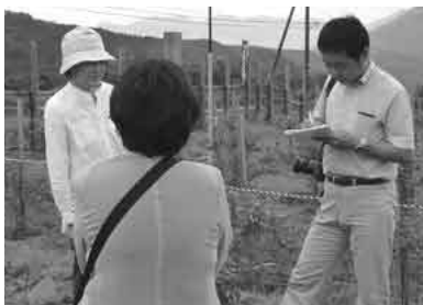
▲日本最大級、2万本のブルーベリーは夏大根の休耕地を利用して植えたそうです。オープン初日だったので新聞社から取材をうけました。