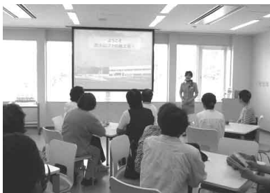
▲製品の製造とともに大切な水のために森も育てていますと説明をうけています。