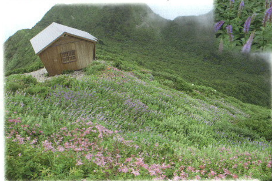
ユートピア避難小屋周辺 360度、花の群生が見られる