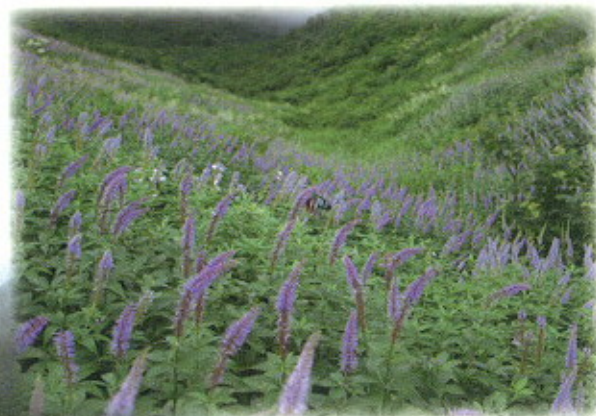
ナンゴククガイソウの群生