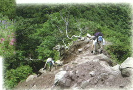
きれいな所に行くには、こんな難所も…