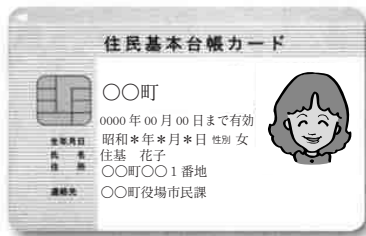
「写真付き住基カード」

手続きは、役場住民生活課または、各支所総合窓口課で申請と受け取りができます。有効期間は、10年間です。