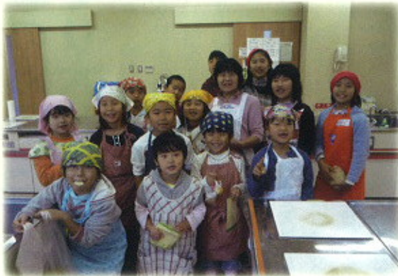
おいしいお菓子ができて大満足