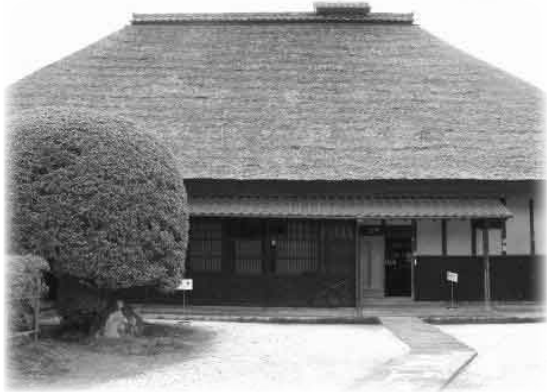
▲重要文化財門脇家住宅 (大山町所子 360 番地)

鳥取県の大型民家を代表する門脇家住宅は、明和6(1769)年に建てられた茅葺屋根・寄棟造の旧家です。土間から見える高く組み上げられた太い梁が豪壮な様相を表しています。また、文政年間に建てられた茶室は坪庭と調和してみごとな景観を作り出しています。