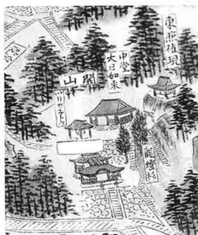
大日堂と東照権現社（「伯州角盤山大山寺絵図」より）