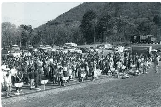
▲大山博労座で行われた開会式の様子

恒例の大山春の一斉清掃が4月19日、大山山ろく一帯で行われ約700人が清掃作業に汗を流しました。この取り組みは、大山の美化活動に賛同する県中・西部の公共団体・事業所・学校などで組織する「大山の美化を推進する会」（会長 大山町長）が主催するもので、毎年春と秋の2回実施しています。参加者は、大山博労座、榎水高原、香取地区、赤松地区、鏡ヶ成、大平原（奥大山スキー場周辺）の6地区に分かれて作業を行い、この日集めたごみは合計で約1トンになりました。