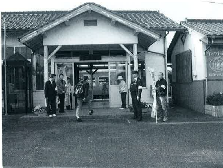
下市駅前での様子

更生保護女性会の皆さんとともに、列車を利用する高校生や大人に向かって、「おはようございます」と大きな声であいさつを交わしました。恥ずかしそうに頭をぺこりと下げただけ、にっこりといさつを返してくれるなど、高校生の対応はさまざまですが、参加された皆さんはあいさつを通してのふれあいに確かな手ごたえをつかんでいました。