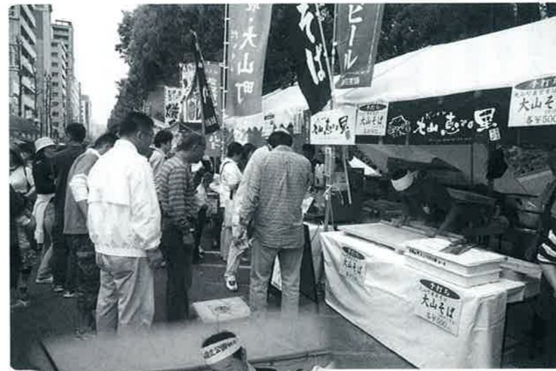
広島フラワーフェスティバルに出店