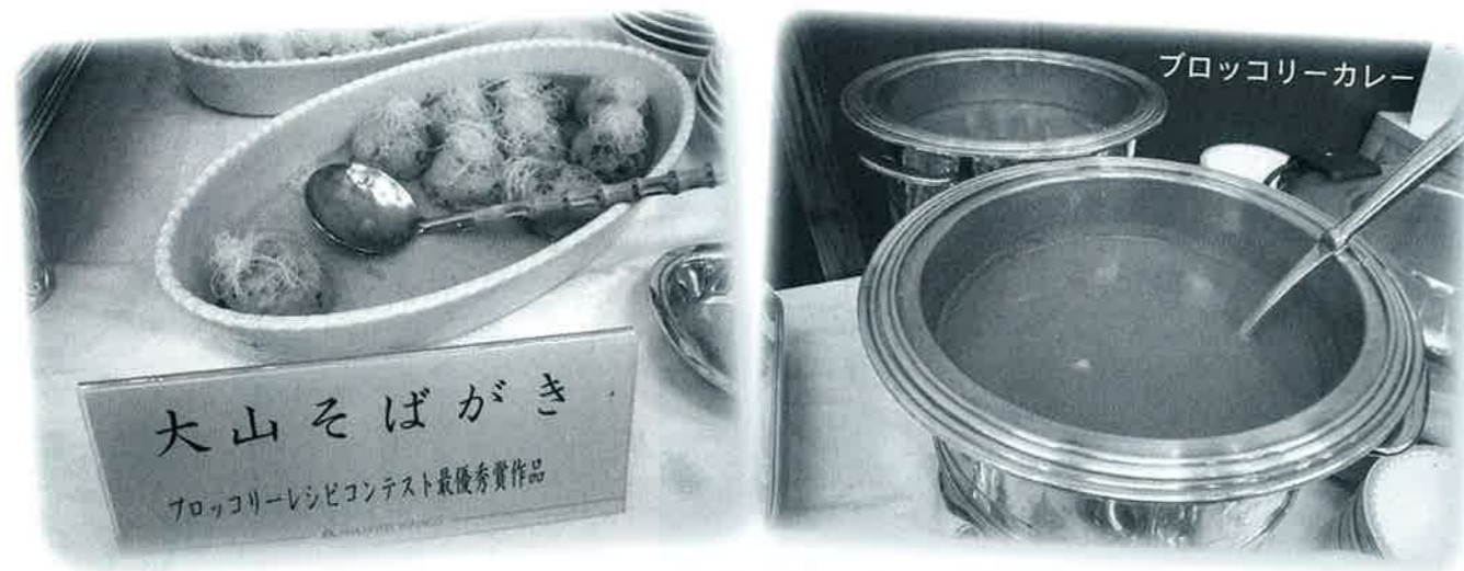
ブロッコリーカレー

今後も町内のグループを主体に、公社はお手伝いとして、市場標的に合ったイベントに出店して参ります。 来年の広島フラワーフェスティバルやイベント出店に参加されたい町内グループの方はお気軽にご相談ください。