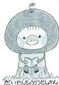
だいせんちゅうりつとじかん

読み聞かせを通して、子どもたちと交流してみませんか？ 読み聞かせボランティアに興味をお持ちの方はもちろん、 日々読み聞かせを实践されている方も大歓迎です。