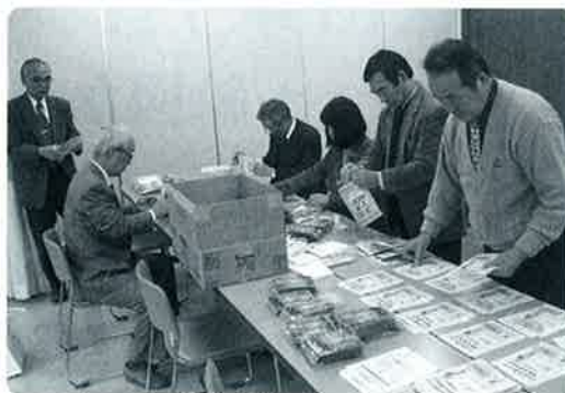
啓発物品の袋詰め作業をする人権擁護委員

子どもたちが協力して育てることを通じて「いのちの大切さ」や「相手への思いやり」という人権尊重思想を育みます。