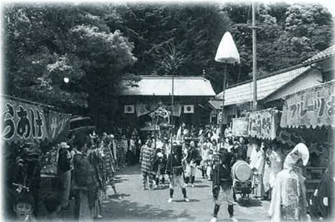
地元高校生による烏毛、白毛の華麗な舞が注目を集めました

また境内の御幸場では、神事のほか氏子の乙女たちが「浦安の舞」を神前に奉納。参拝者の注目を集めました。