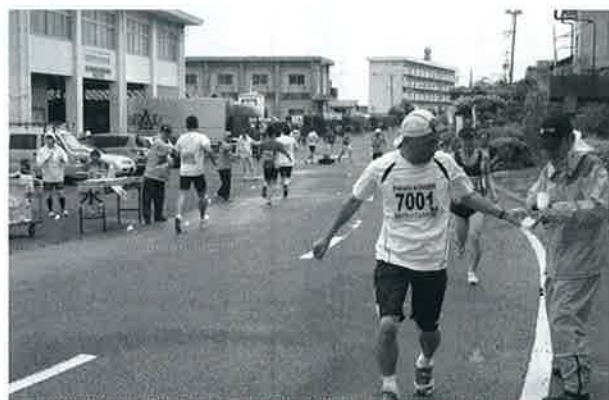
▲ 10キロ折り返し点の第1給水所の県漁協御来屋支所前