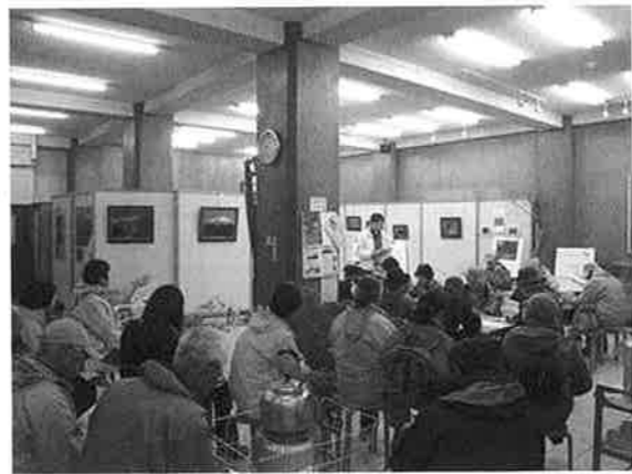
▲担当者が絵図資料で説明（「大山参道ギャラリー」にて）

そこで、もっとみなさんに大山寺僧坊跡についてもっと知っていただこうと、4月26日（日）に「大山寺僧坊跡観察会」（社会教育課主催）を開きました。観察会には町内外から約30人の参加がありました。