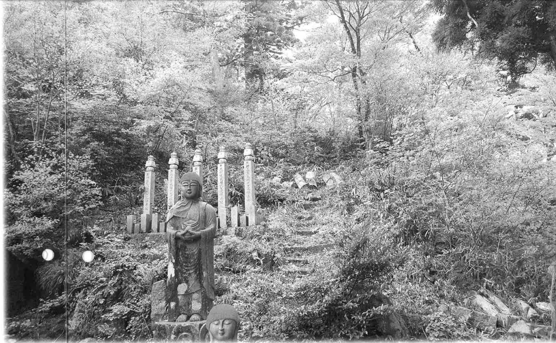
東照権現社跡へ登る階段

今回は実際に僧坊跡群を歩いて観察することはできませんでしたが「ぜひ、再度企画してほしい」といった要望もいただきました。社会教育課では、今後も大山寺僧坊跡についての観察会などを計画していきます。ぜひご参加をお願いします。