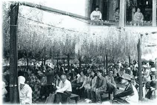
最終日には藤棚の下に入りきらないほどのお客さんが