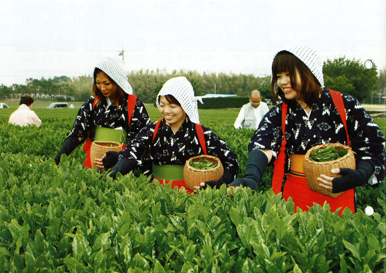
新茶を摘む乙女たち(陣構)