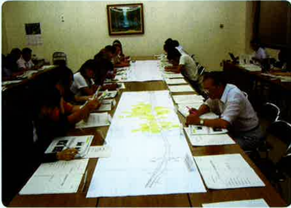
▲交差点周辺が抱える問題点について話し合う協議会の皆さん（中山農村環境改善センター）

6月8日に行われた交通安全総点検で出た意見を基に、今後協議を進めていくことを確認しました。地元住民からは「車道と歩道の間に段差があるが、車が突っ込んでくる恐れもあるので防護柵を設けられないだろうか」などの意見が出されました。