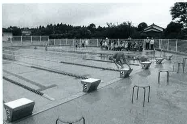
きれいなプールで力泳を披露