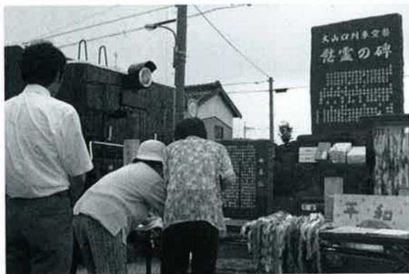
64年経った今も遺族の思いは変わらない (大山口駅横の慰霊の碑前で列車空襲の犠牲者を追悼する参列者)

大山口列車空襲事件の犠牲者の追悼と平和への祈りを込めた「慰霊と平和祈念の集い」が、列車空襲のあった7月28日、大山口駅の慰霊碑前で行われました。 大山口列車空襲事件とは、今から64年前の昭和20年7月28日朝8時ごろ、11両編成（うち前2両が赤十字マークを掲げた傷病者専用車両）の鳥取発出雲今市（現出雲市）行き列車が、大山口駅手前200m（上野集落近傍）の地点で、米海軍艦載機による銃爆撃を受け、傷病兵と一般市民の45人が死亡し、また多くの負傷者を出した、痛ましくも忘れてはならない事件です。 この日の式典には、遺族や当時この事件に遭遇した方をはじめ、平和学習で大山口列車空襲事件を学んだ大山町内外の小学生など約150人が参列し、犠牲者を追悼するとともに、戦争のない平和な社会の実現に祈りを捧げました。