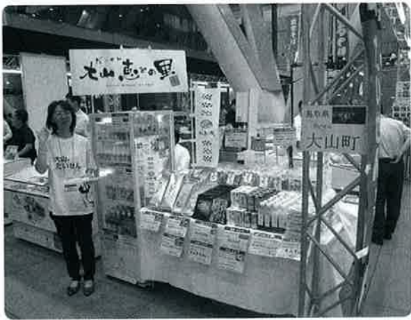
▲東京国際フォーラム(有楽町)で大山の恵みをPR

有楽町の東京国際フォーラムで開催の「地域の魅力セレクション2009」に参加しました。地域の隠れた産品を首都圏の消費者や流通業者に知ってもらい、販路開拓を目指すところと全国から約400ブースの参加があり、大変多くの来場者でにぎわいました。大山町からは飲むヨーグルトなどを販売しPRしました。来場者からは「大山って山だけじゃなく海もあるんですね」、「大山でピーナッツが出来るんですね」などの反応がありました。多くの首都圏の方に大きい山と書いて「だいせん」と読み、さまざまな特産品があることを知っていただく良い機会となりました。