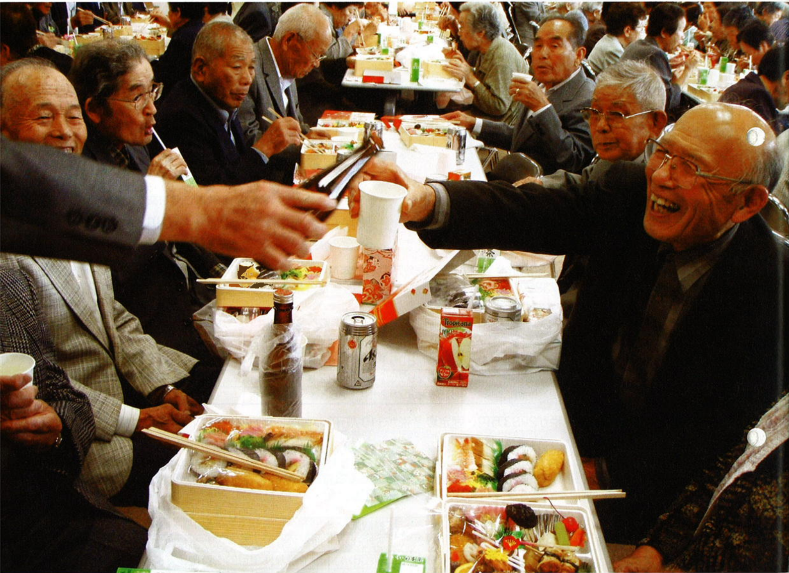
笑顔があふれる敬老会