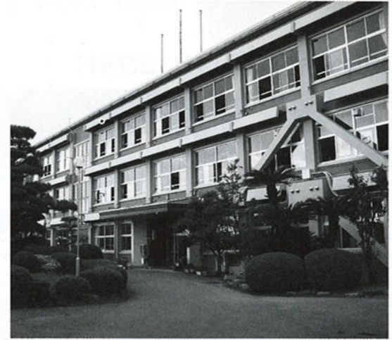
完了した大山中耐震補強工事

9月定例議会は、9月8日から29日までの22日間の会期中で開かれました。平成20年度決算認定と平成21年度補正予算、条例改正等の38議案、議員提案の1議案を審議し、原案のとおり可決しました。決算審査特別委員会は、長引く経済不況のもと、滞納対策への意欲的な取り組みは評価したものの、および、 そ6億1600万円に及ぶ各種税金・使用料等の未収金、滞納総額の49.8%を占める住宅新築資金等貸付金や、19年度と比較し徴収率が低下した国民健康保険の対応は、行政の課題であり、関係各課総力をあげて、さらなる滞納対策の充実・強化に努めるよう求めました。