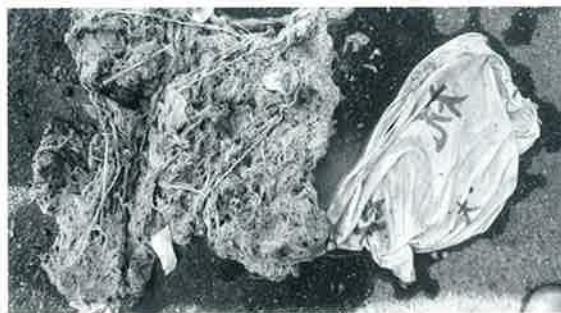
▲繊維がほどけ、余計につまりやすくなります。