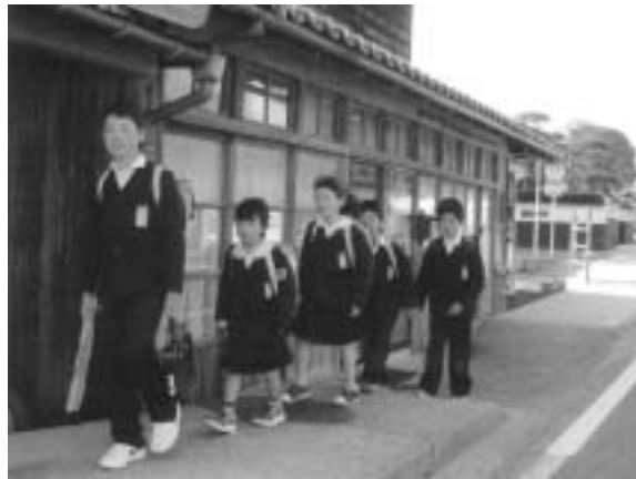
《登校班》上級生と一緒に仲良く登校。1年生のペースに合わせて安全に登校しています

内小学校は、全ての教職員が、使命感と情熱をもって、創意あふれる取り組みをすることによって、小規模校だからこそできる教育の推進を図ります。