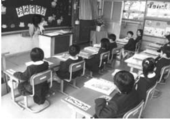
はじめての教室、新しい教科書。ドキドキの学校生活が始まります

1年生一人ひとりを温かく見守り、気持ちに寄り添いながら、安心できる教室、安心できる学校を創っていくことの使命と責任を感じたことでした。