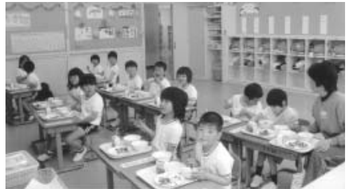
《給食タイム》緊張もゆるむ楽しい給食

また、伝統の「かわ三運動」として、本読み・あいさつ・なわとびを全校ぐるみで取り組んでいきます。ベストワンを目指すのではなく、児童一人ひとりを大切に、一人ひとりのよさや持てる力を十分に伸ばしていくオンラインワンの教育を実践しますので、ご家庭・地域のみなさまのあたにかいご支援・ご協力をどうぞよろしくお願いたします。