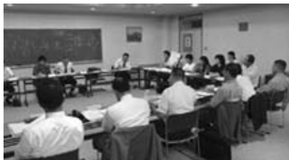
学校建築をめぐる様々な問題について、毎回白熱した議論がおこなわれました