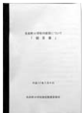
今回提出された提言書