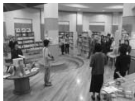
米子市立福生西小学校