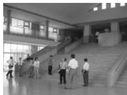
鳥取市立鹿野小学校