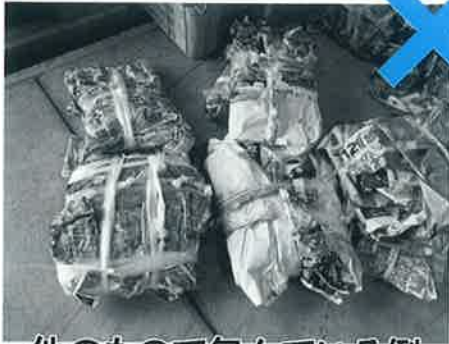
他のもので包んでいる例

新聞紙や古雑誌は他のもので 包まずに、そのままひもで十字 に束ねて出してください。