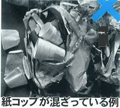
紙コップが混ざっている例

古紙以外のもの（ビニール、 紙コップなど）が混ざっている ものが見受けられます。