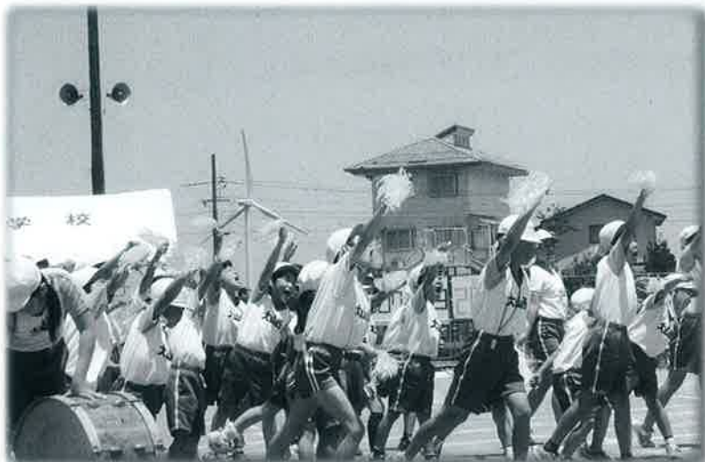
◀強風にも負けず色別の応援合戦 (大山西小)