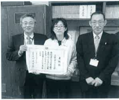
▲中山小校長室で受賞伝達

中山小学校は、このほど「平成22年度子ども読書活動優秀実践校」として文部科学大臣表彰を受賞しました。図書館は本を通して、いろいろな人・情報・世界と出会う場所です。同校の図書館も多くの出会いの場となるよう、図書委員会活動や読書祭り、第二図書館「絵本の国」の充実など、町立図書館や読み語りボランティア「麦の会」と協力し工夫しながら、読書推進に取り組んでいることが高く評価されました。