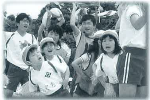
▲力のこもった応援合戦 (中山小)