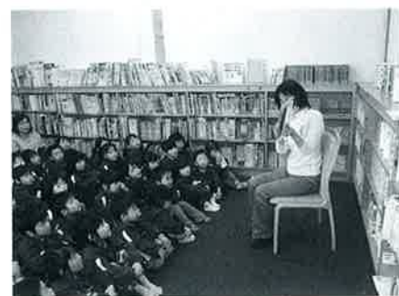
▲町立図書館で絵本の世界へ

4月23日から始まった子ども読書週間に、3歳児から5歳児まで計42人が町立図書館を訪ねました。