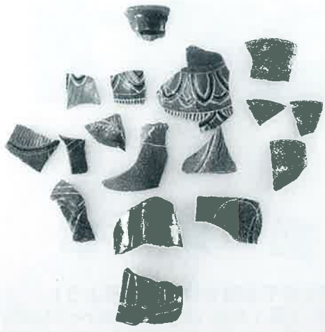
朝鮮半島産陶磁器

記録には残っていませんが、大山寺のような日本海に面した有力寺院も、このような私貿易を行っていた可能性はおおいにあります。それが経済基盤を支え、物流拠点になり得たとともに、大きな勢力を持つことができた要因であったと考えることもできます。