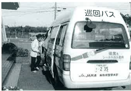
▲区間・便によってはお客があるが……

例えば巡回バス（定員13人）の1便あたりの平均乗車人員と収支は、名和巡回バスが3・68人で、約△3,000円。中山巡回バスが1・9人で約△2,500円。名和と中山の巡回バスの年間赤字額に対して、国県の補助金を受けても約900万円が赤字です。