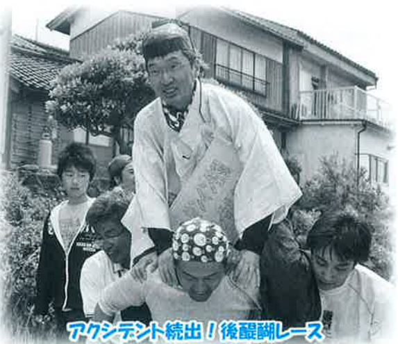
アクシデント続出!後醍醐レース

恒例となった後醍醐レースには15チーム(うち1チームは子どもチーム)が参加し、今年も熱戦が繰り広げられました。優勝したのは「エビまつりチーム」と「大山やすらぎの里ジュニアチーム」の皆さんでした。