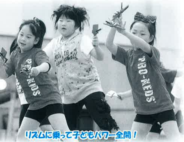
リズムに乗って子どもパワー全開!