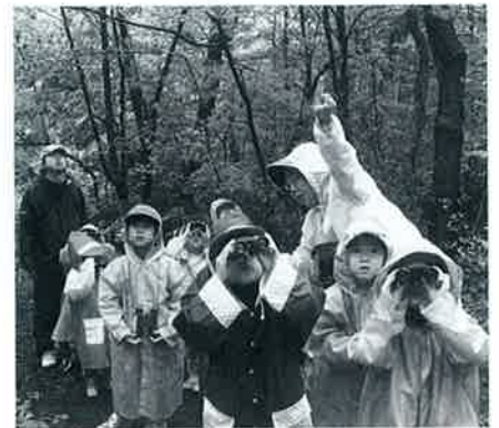
▲森の中は、おどろきがいっぱい

大山保育所では、園児が年間を通じて身近な自然に触れ、四季折々の美しさ、不思議さなどを発見する中で、ふるさとを愛する心が育つような保育を進めています。そこで愛鳥週間にちなみ、5月11日(火)に年長児が大山青年の家でバードウォッチングをしました。