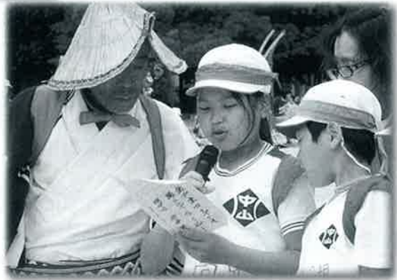
◀地域と一体となって踊る「いさい踊り」を盛り上げる各調子 (中山小)