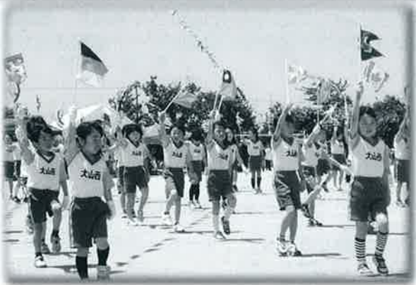
▶下学年ダンス (大山西小)