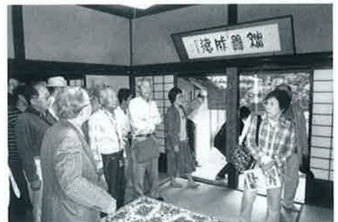
▲ 門脇家住宅を見学

県立むきばんだ史跡公園」では、熟した桑の実を見つけ、懐かしい味に再会する場面も。大山寺の圓流院では、鬼太郎など水木しげるの作品に登場する妖怪108態の天井画を見学。本堂におお向けに寝て天井を見上げながら説明を聞きました。夕食の後はお待ちかねの前夜祭に出かけ、大山寺参道を照らす幻想的な2,000本のたいまつ行列を見物して初日を終わりました。ツアー客の中には、一緒に歩いてみたいといま