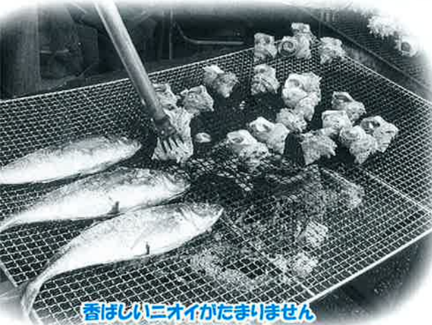
香ばしいニオイがたまりません