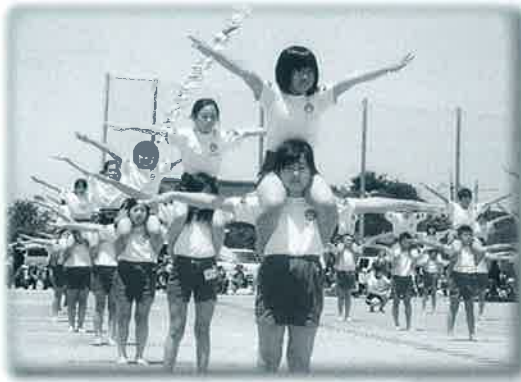
◀ 5・6年組体操 (名和小)