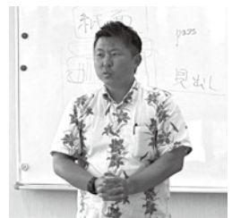
▲かりゆしに宿る「38年の絆」

大山の緑と沖縄の青をつなぐ新しい風を、みなさまと共に感じていきたいと考えています。