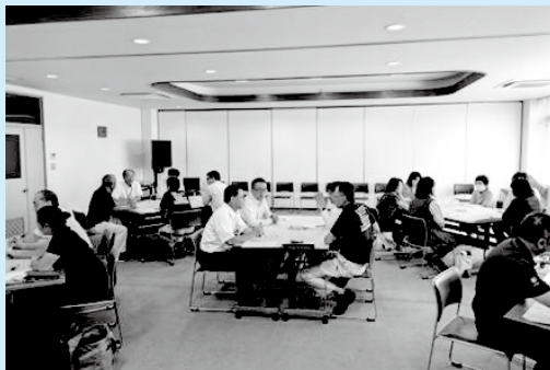
ワーキング・グループ会議

計画の策定では、町民アンケートやワーキング・グループ会議、審議会など多くの皆さんに協力していただきました。