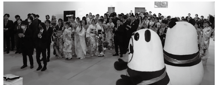
▲令和8年成人式 交流会の様子