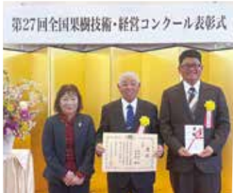
第27回全国果樹技術・経営コンクール表彰式

両氏は梨の「二十世紀」から「新甘泉」、「王秋」への品種転換と柿の「輝太郎」の導入により省力化と安定的収益の確保を両立。技術を継承しながら親子で効率的な家族経営を展開されています。また、若手組織の設立や団地再造成を通じた後継者育成など、果樹産地の維持継続に尽力されました。こうした取り組みが模範となる果樹農業者であると認められ、今回の受賞となりました。