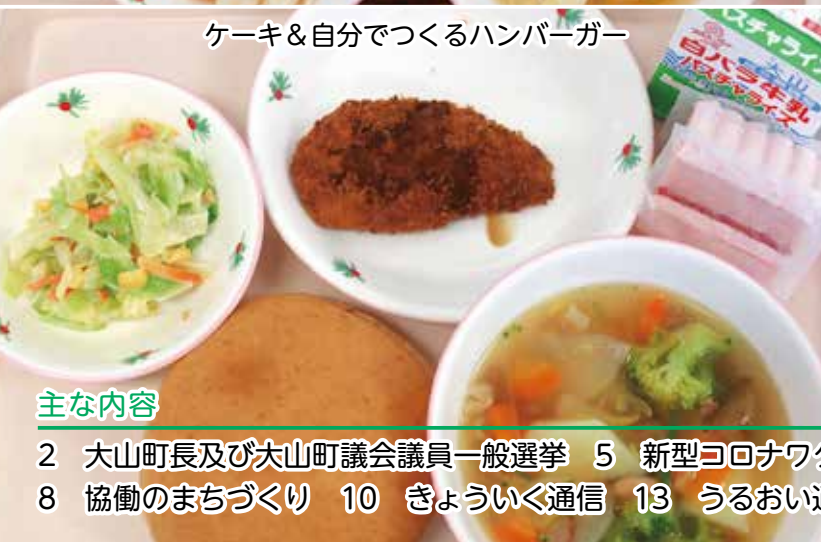
ケーキ&自分で作るハンバーガー