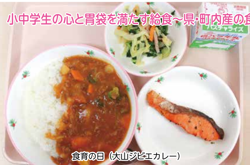
食育の日（大山ジビエカレー）

小中学生の心と胃袋を満たす給食～県・町内産の食材を活用し、工夫を凝らした献立になっています～