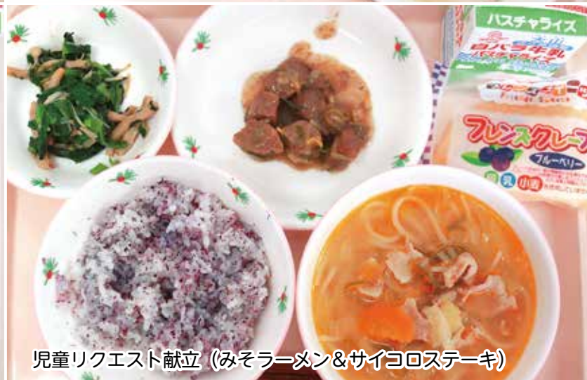
児童リクエスト献立（みそラーメン&サイコロステーキ）