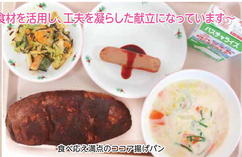
食べ応え満点のココア揚げパン