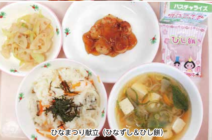
ひなまつり献立（ひなずし&ひし餅）