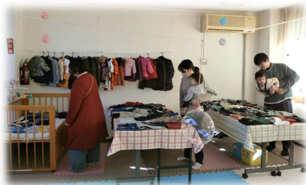
～支援センターなわ～