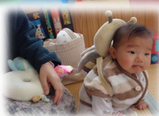
～ 支援センターだいせん～