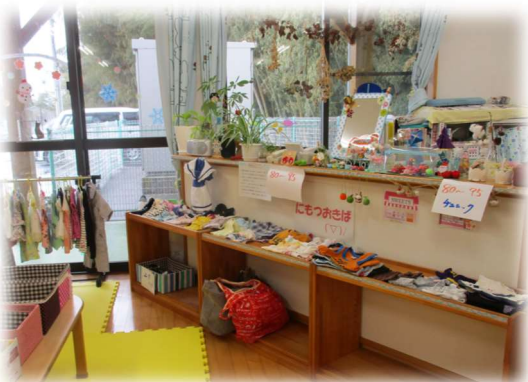
～ 支援センターなかやま～

この時期、暖房による乾燥や閉め切った部屋などで、様々な感染症が広がりやすくなっています。 身近な感染症として、インフルエンザ・コロナ・風疹・水痘・おたふくかぜ・RSウイルス感染症・溶連菌感染症・マイコプラズマ肺炎・リンゴ病などがあります。 咳やくしゃみ、話をする時のつばが、原因の一つ。 おうちでも、加湿器を使ったり、濡れタオル等を干したり、こまめに空気の入れ替えをしましょう。 日頃より食事や睡眠をしっかりとって病気に負けない体づくりを心がけましょう◎