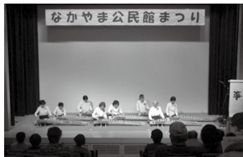
▲ 箏教室による華麗な演奏

2月27日と28日、中山生活想像館でなかやま公民館まつりが行われました。パッチワーク教室などの展示や、バザー、マジック同好会・箏教室によるステージなど、練習の成果が発表されました。