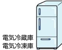
電気冷蔵庫 電気冷凍庫