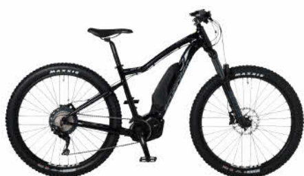
電動マウンテンバイク

電動マウンテンバイクから女性や小学生に合わせた小さめサイズの自転車もご用意しています。