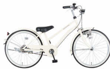
シティサイクル(子供用)