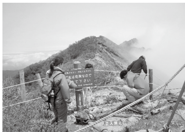
登山道の清掃作業