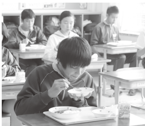
おいしい学校給食をいただきます