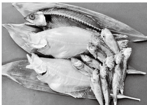
乾燥機で作った干物をふるさと納税返礼品にしています