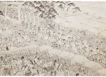
大山寺博勞市図（伝歌川広重）

地蔵菩薩が生きとし生けるものすべてを救う仏さまであることから、平安時代に大山寺の高僧、基好上人が、牛馬安全を祈願する守り札を配るとともに、山の中腹に広がる牧野で牛馬の放牧も奨励しました。こうして大山の「牛馬信仰」が広まって行きました。平安時代の説話集『今昔物語集』からは、遠方からの参詣者が牛馬に供物・荷物を運搬させていたことがわかります。生計の柱である農耕に欠かせない牛馬の飼育でしたので、人々は牛馬を曳き連れて大山寺に参って守り札をいただき、牛馬にも「利生水」を飲ませてその延命を祈りました。さらに守り札は牛舎の柱に貼って安全を祈り続けました。