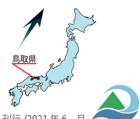
【構成市町村】 鳥取県 大山町・伯耆町・江府町・米子市