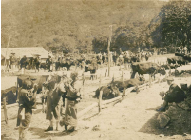
「博勞座」の様子（昭和6年）

江戸時代中頃になると、大山寺が積極的に牛馬市の経営に乗り出し、市は大山寺境内の下にある「博勞座」で春祭りに開かれることになりました。この寺の庇護のもとにという特徴が、信仰が育んだ全国唯一の「大山牛馬市」とされる理由