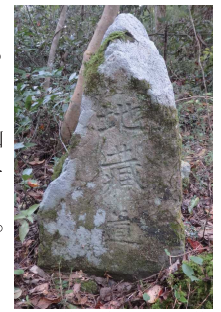
「地蔵道」道標（坊領道）

このように、水の恵みに延命を求める地蔵信仰に由来する「大山信仰」と「牛馬信仰」は、牛馬市の隆盛も手伝って西日本に大きな信仰圏を形成しました。それは、あたかも大山からの天恵の水が伏流水となったがごとく、長い歳月を経て人々の生活文化の中に沁みわたり、静かに根付いたものです。そして、とりわけ裾野に暮らす人々は「大山さんのおかげ」と日々感謝しつつ大山を仰ぎ見続けているのです。