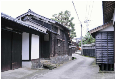
坊領道沿いにある所子の町並み

また、横手道には山陽筋からの途中で参詣が困難となった人が大山を望んで拜むための鳥居や、女人禁制の時節などに女性が拝礼する場所だった「文殊堂」、川床道には苔むした石畳道、各道の道端には地蔵菩薩にちなむ一町地蔵などが残っています。川床道にある一息坂峠で