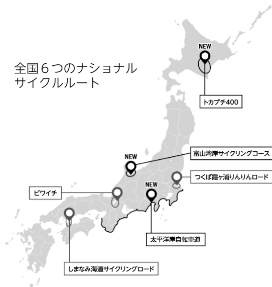
全国6つのナショナルサイクルルート

優れた観光資源を有機的に連携したサイクルツーリズムの推進により、日本における新たな観光価値を創造し、地域の創成を図るために、一定水準を満たすルートを国が指定する制度です。新たなルートの指定については、国の自転車活用推進計画期間内に1回とし、3～5年ごとに実施されます。現在、全国で6つのルートが指定されています。