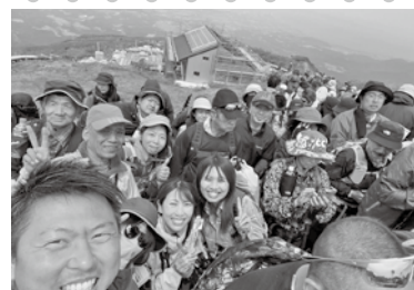
▲【最近の一枚】夏山開き山頂祭直後の自撮り

活動が思うようにできなかったこの3年間の空気を、大きく変えるような力を感じた大山の夏山開き。健康づくりやレジャーなどで、今シーズンも大山を満喫しましょう!