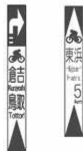
ルート案内の路面表示の例