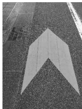
走行環境を示す矢羽根