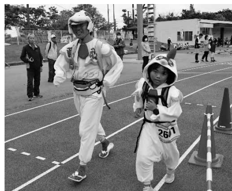
▲仮装のランナーも大会を盛り上げました

今大会も大山町スポーツ協会各専門部員やスポーツ推進委員、コース沿道集落のみなさんなど多くのボランティアスタッフに支えられて、とても暖かいアットホームな大会となりました。