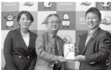
有限会社静間の森代表取締役 (左) 有限会社静間の齋藤顧問 (中央)

寄附金は、町民を対象とした健康づくり、フレイル予防、運動習慣確立事業に活用させていただきます。