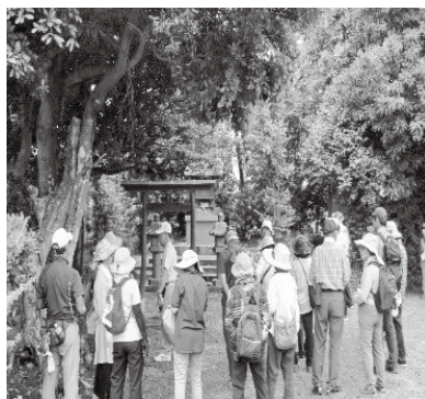
▲解説を聞く参加者のみなさん

当日は各自万歩計を持って七荒神を軸にウォーキングをスタート。道中、2か所の健康チェックポイントで、姿勢や健康予防など『からだを整える』ことを意識しました。完歩後はかくわの郷庄内でもてなしを受け、地域の方との交流も深めることができました。