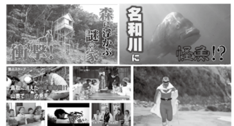
▲これまでに放送した番組の画像

大山チャンネルの企画の多くは、町民のみならず、みなさまからの情報が元になっています。教えていただいた情報や取材の依頼は、できるかぎり番組にしてお届けしますので、お気軽にご連絡ください。