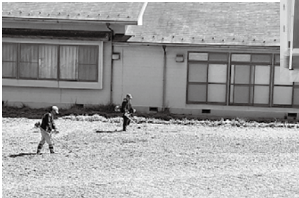
広い園庭も子どもたちが走り回れるようきれいに整備しています ▼